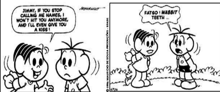
Copyright ©1999 Mauricio de Sousa Produções Ltda. Redistribution in whole or in part prohibited.